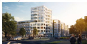
NRW/Düsseldorf Pempelfort Oberbilk